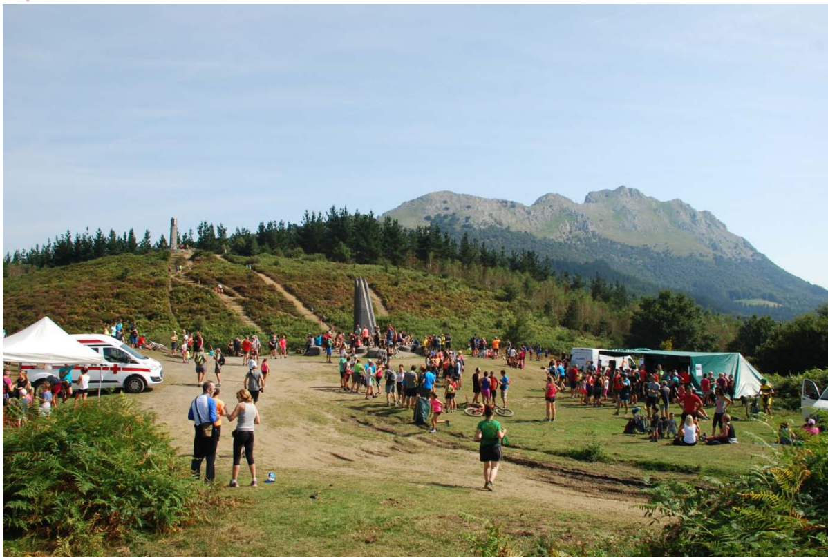
Rutas de acceso al monumento tradicional (superior)