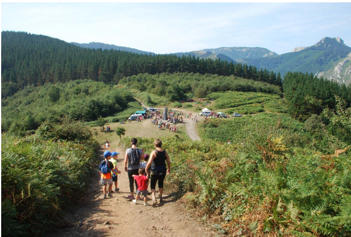
Monumento moderno y explanada (desde la plataforma superior)